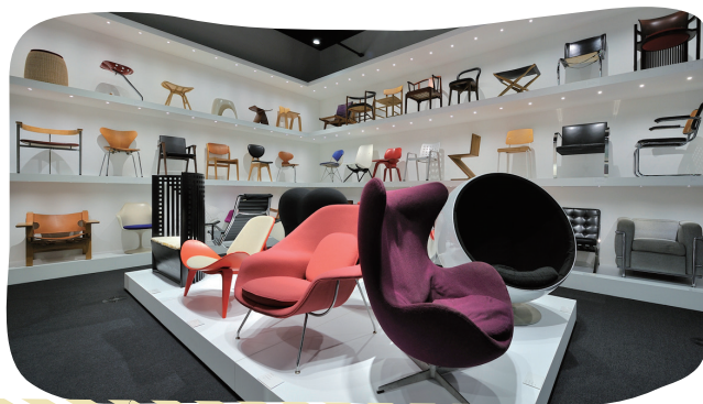
《椅子ギャラリー》 武蔵野美術大学美術館内にあり、近代椅子コレクション約350脚のうち、約100脚を収蔵展示している。通常一般開放はされていないが、ガラス壁越しからの鑑賞は可能。