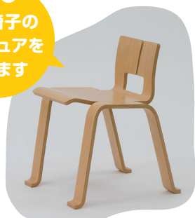
《ペリアンチェア(サイドチェア)》 シャルロット・ペリアン 1953年(初号)