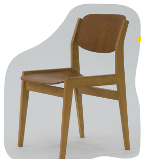
《サイドチェア No.507》 水之江忠臣 1954年(初号)