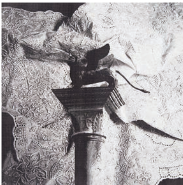
図版3. オペラコンチェルト「オテロ」 コンセプトイメージ 2000年ごろ