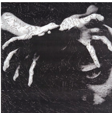
図版4. オペラコンチェルト「オテロ」 コンセプトイメージ 2000年ごろ