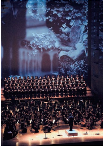
図版2. オペラコンチェルト「オテロ」 オーチャードホール 2000年