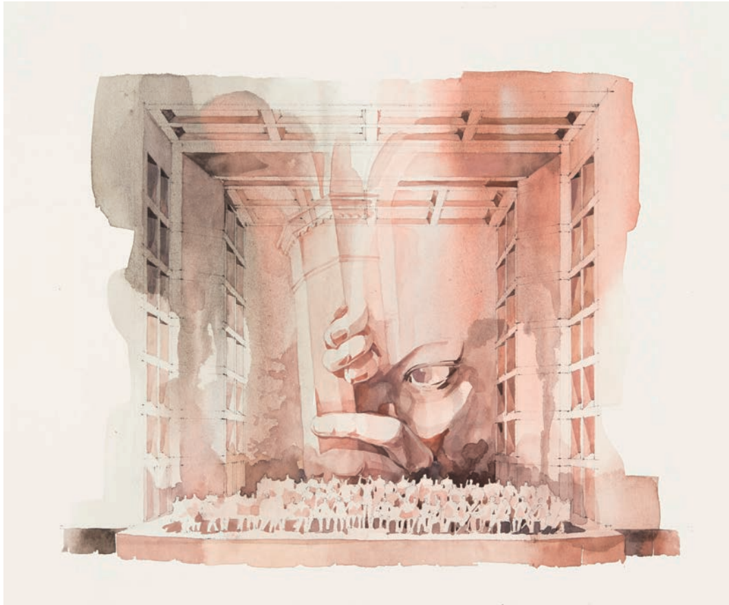
図版1. オペラコンチェルト「オテロ」舞台イメージ画 2000 年ごろ