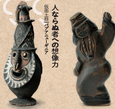
人ならぬ者への想像力 仮面土器「パプアニューギニア」

みんなく創設50周年記念特別展 「民具のミカタ博覧会」 —見つけて、みつめて、知恵の素— A Special Exhibition for the 50th Anniversary of the Museum's Founding: MINGU Design Expo — Discovering Sources of Wisdom 2025年3月20日(木・祝) →6月3日(火) 10:00-17:00(入館は16:30まで) 休館日=水曜日 会場=国立民族学博物館 特別展示館 *詳細については国立民族学博物館webサイトで確認ください。 みんなく特別展HP