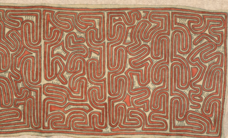
反復・成長していく図像 タパクロス・パプアニューギニア