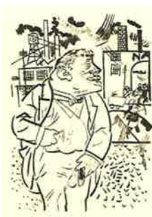
Die Räuber. Berlin: Der Malik-Verlag, 1923. 『群盗』