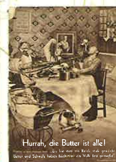
AIZ, 14. Jahrgang, nr. 51. Berlin: Neuer Deutscher Verlag, 1935. 『労働者画報』