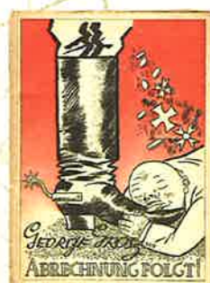
Abrechnung Folgt! Berlin: Der Malik-Verlag, 1923. 『けりはつけてやる』