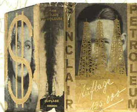
Petroleum. Berlin: Der Malik-Verlag, 1931. 『石油』