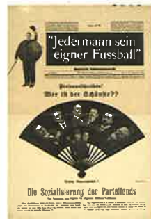
Jedermann sein eigener Fussball. Berlin: Der Malik-Verlag, 1919. 『みんな自分のフットボール』