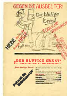
Der Blutige Ernst, [No.3] Berlin: Trianon-Verlag, 1919. 『デア・ブルーティゲ・エルンスト』

※詳細についてはウェブサイトをご確認ください。イベント日時が決定次第、公開致します。