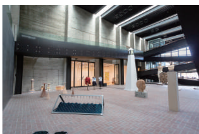
図版7. 「助教・助手展 2021」展示風景 2021年

人々の日々の暮らしから生まれる造形には、生活の現場において理にかなったデザインのアイデアが秘められている。本展では、形態、機能、素材、意味などを切り口に、民具が持つ豊かなデザインと発想に新たな価値を見だし、ユーモアと見立ての造形にまなぶことで、美術大学における民俗資料の可能性を考える機会とする。