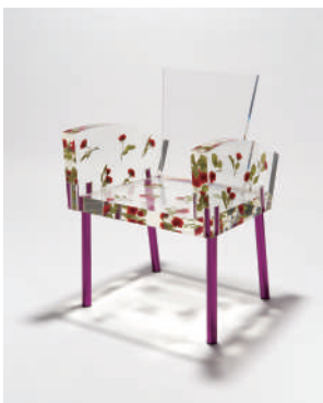
図版2. 倉俣史朗《ミス・プランチ》1988年 武蔵野美術大学 美術館・図書館所蔵

本学学部卒業制作および大学院修了制作において、優秀賞を受賞した学生約100名の作品を2期に分けて展示する。絵画や彫刻、版画、グラフィックデザイン、工芸、建築、映像、パフォーマンスなどの諸作品や研究論文を通して、本学で実践されている幅広い美術教育の成果を紹介する。