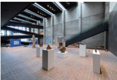
図版1.「令和2年度 武蔵野美術大学 卒業・修了制作 優秀作品展」展示風景 2021年

武蔵野美術大学 美術館・図書館が主催する2022年の展覧会スケジュールをお知らせします。また、2022年度より、展覧会会期中は日曜日・祝日も開館することとなりました。平日のご来館が難しかった方も、ぜひこの機会にお越しください。みなさまのご来館をこころよりお待ちしております。