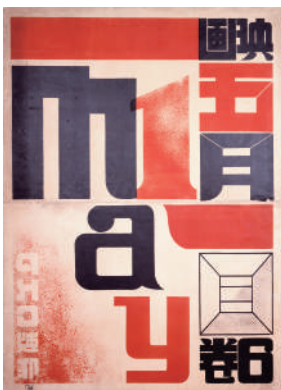
図版3. 原弘 ポスター《映画五月一日6巻》 1927-29年(推定) 特種東海製紙所蔵

日本におけるグラフィックデザインの黎明期を牽引したデザイナー・原弘。本展では「三科」や「造型」を始めとする新興美術運動に身を投じた1920年代の作品を起点として、後の制作姿勢の礎となった1930年代から40年代にかけての仕事を辿る。館蔵作品に加え、特種東海製紙の原弘アーカイブ資料をあわせて展観し、原弘の造型思考の検証を試みる。