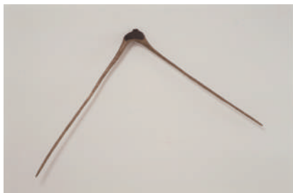
図版4. 黒川弘毅 《SIRIUS No.3》1979-80年 作家蔵