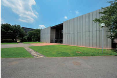
図版 8. 美術館外観