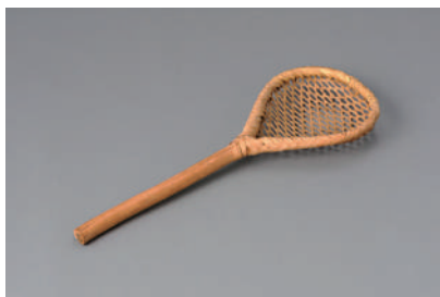
図版6. スイノウ (水囊) [新潟] 武蔵野美術大学 美術館・図書館 民俗資料室所蔵

AGAIN-ST (アゲインスト)は、彫刻を主な表現領域とする作家・美術教育者である富井大裕、深井聡一郎、藤原彩人、保井智貴に加え、近現代彫刻研究を専門とする石崎尚、デザイナーの小山麻子によって2012年に結成された。日本の彫刻の現状とその有効性について、正解を求めるのではなく考える機会を創出すべく活動する彼らの10回目の展覧会は、道具とメディウムの可能性に焦点をあてる。