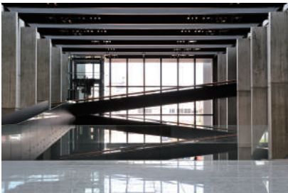
図版 9. 美術館内観

※新型コロナウイルス感染症の影響により、会期・時間を変更、あるいは予約制を導入する場合があります。最新情報は web サイトでご確認ください。