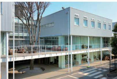
図版10. 民俗資料室（13号館）外観