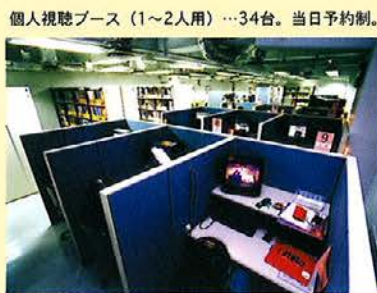
個人視聴ブース (1~2人用) ... 34台。当日予約制。 団体視聴ブース (2~7人用) ... 2部屋。予約制。(1週間前より予約可)

個人視聴ブースと団体視聴ブースがあり、DVD,VHS,LD,CDなどが視聴できます。