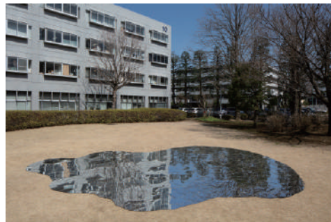
図版 3. 造形学部 空間演出デザイン学科 飛塚 瑠子 《ここに風景がある》