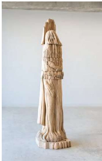
図版 2. 造形学部 彫刻学科 黒瀧 舞衣 《衣に依る》