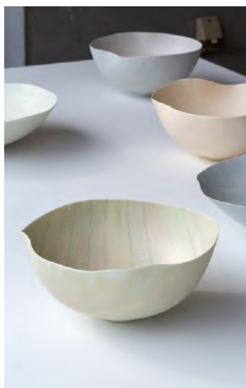
図版 7. 大学院造形研究科 デザイン専攻 工芸工業デザインコース デン エン 《Palette》