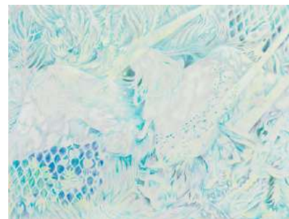
図版 4. 造形学部 油絵学科 [油絵専攻] 田野 勝晴 《縫光》