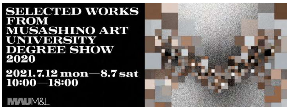
図版1. メインビジュアル

Selected Works from Musashino Art University Degree Show 2020