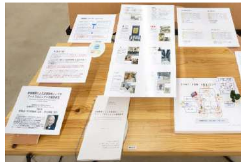
図版 9. 大学院造形構想研究科 造形構想専攻 クリエイティブリーダーシップコース 木越 純 《金融機関による企業戦略としてのアートプロジェクトの事例研究》

図版 1. メインビジュアル デザイン: 三上悠里、図版 2, 4, 5, 8. 撮影: 稲口俊太、図版 3, 6, 7, 9. 撮影: 大塚 敬太