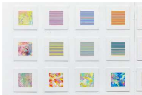
図版 5. 造形学部 視覚伝達デザイン学科 濱田 汐音 《色彩の主観的な美》